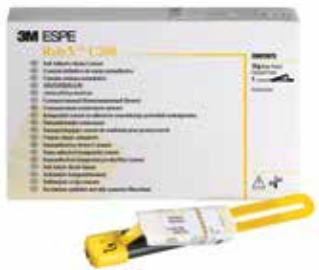
3M™ RelyX™ U200 Clicker™ Dispensador – Tono A2 (56878)